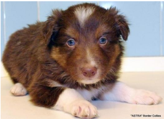
Welpen mit deutlichen Abzeichen