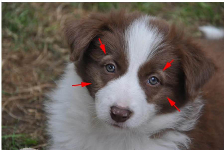
8 Wochen alter Welpen mit Abzeichen