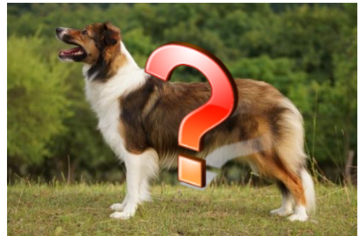
Muster der erwachsene Hund