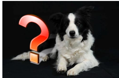
Muster der erwachsene Hund