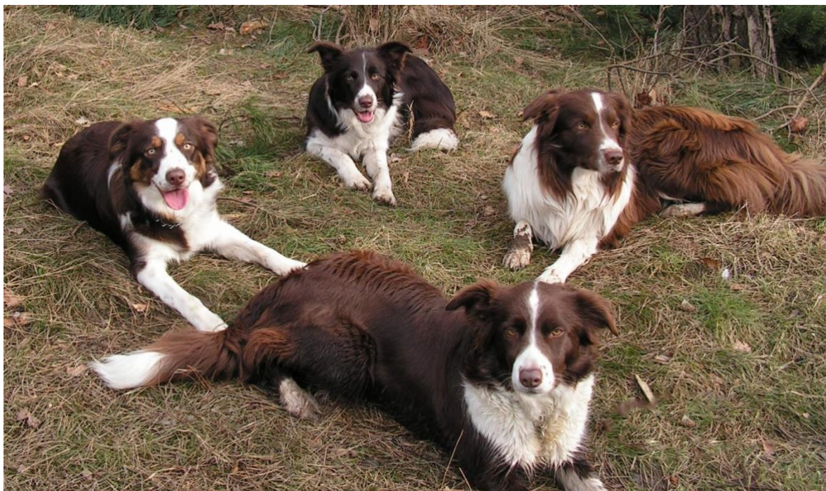
einige Beispiele für Chocolate Tönungen