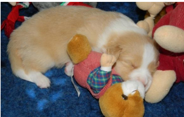
Welpen mit 2 Wochen

Augenfarbe Die Augenfarbe kann (wie das Nasenpigment auch) entsprechend der genetischen Eumelanin-Pigmentierung variieren.