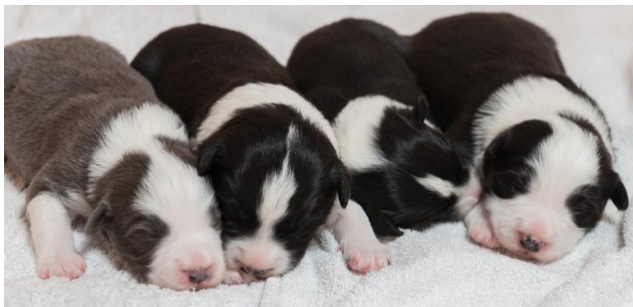
slate direkt neben black