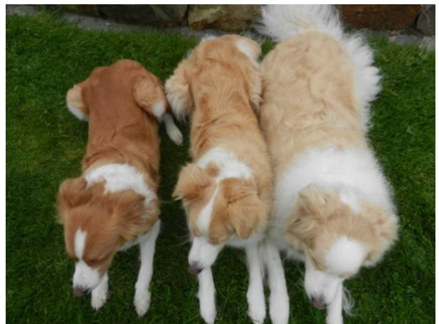
einige Beispiele für rot Tönungen