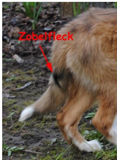
Zobelfleck beim erwachsenen Hund