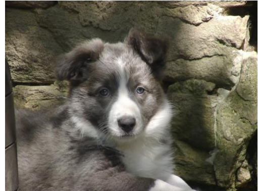
siehe Nase in schiefer