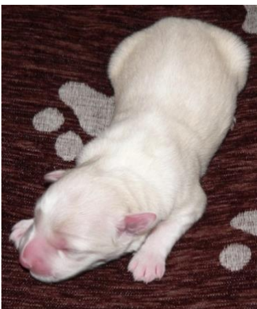
sehr heller Welpe