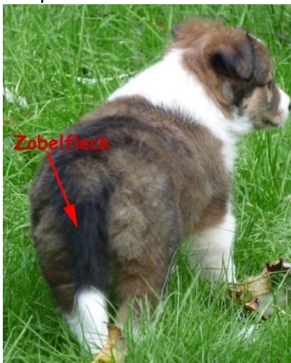
Zobelfleck beim Welpen