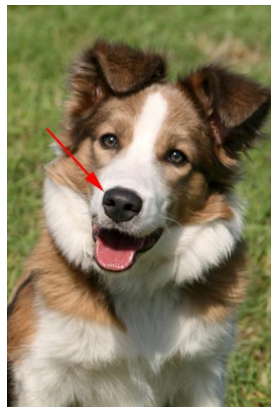
Nase in schiefer