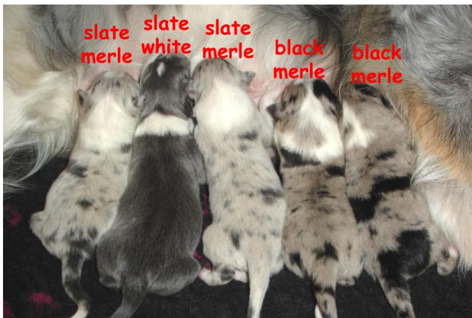
von links: slate/merle, slate/white, slate/merle, black/merle, black/merle