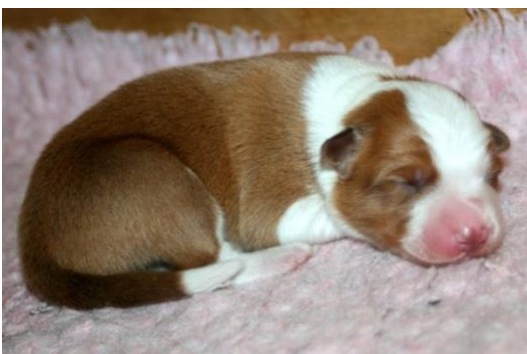
Welpen mit 3 Tagen