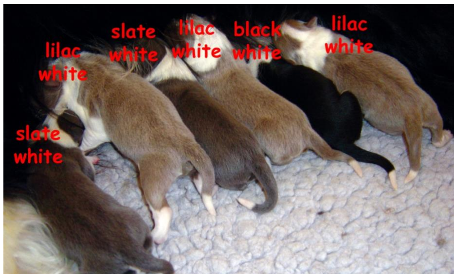
Von links: slate/white, lilac/white, slate/white, lilac/white, black/white, lilac/white