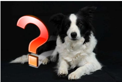
Muster Welpen bis zu 3 Wochen

auch zweifarbige Augen mit Merle-Effekt möglich