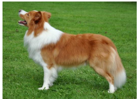
der linke Welpe als erwachsener Hund